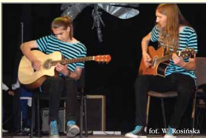
fol. W. Rosińska